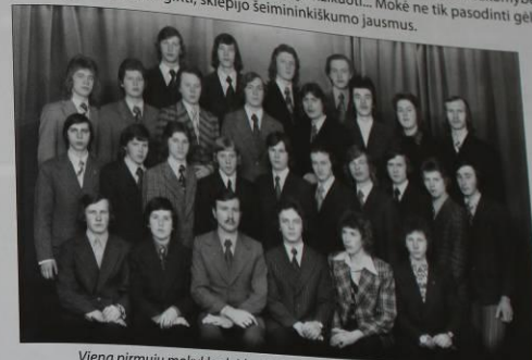
Viena pirmųjų mokyklos laidų. Maisto pramonės įrengimų derintojų grupė, 1978 m.