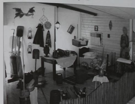
Mokyklos etnografinis kampelis, 2010 m.

Mokykloje taip pat labai daug dėmesio buvo ir yra skiriama sportinei veiklai. Dar tarybiniais laikais surta gera ugdomoji aplinka krepšiniui, lengvajai atletikai, sunkiajai atletikai, tenisiui, turizmui. Pirmieji mokyklos kūno kultūros mokytojai Rimantas Žalys, Kolaitis sumaniai ugde ir ugdo jaunuolių fizinę galias, kasmet mokyklos komandos tampa regiono ir Respublikos nugalėtojomis.