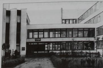
Mokykla, 1975 m., Taikos prospektas 133.

Mokyklą įkūrė tuometinė Lietuvos maisto pramonės ministerija, kuri rūpinosi didžiaisiais Respublikos, ypač Kauno maisto pramonės gigantais: duonos, pieno, mėsos kombinatais, konditerijos, konservų fabrikais, alkoholinių ir nealkoholinių gėrimų gamybos įmonėmis. Mūsų mokykla tapo stambių gamyklų ir įmonių darbininkų rezervo šaltiniu.